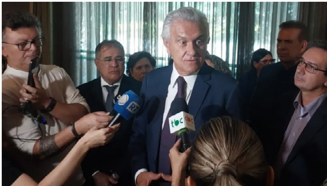
Governador Ronaldo Caiado fala com imprensa sobre programa que une Estado e municípios: parceria com prefeituras

Caiado lembrou que o projeto tem como objetivo fazer