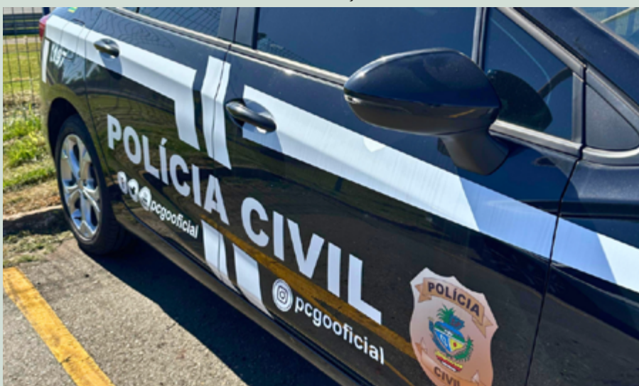
O indivíduo estava sob investigação por envolvimento em um caso que vitimou duas crianças

Diante da gravidade dos fatos, a equipe da Delegacia de Polícia de Cavalcante agiu prontamente para dar cumprimento ao mandado expedido pela Justiça. O suspeito foi detido e conduzido para os procedimentos legais necessários, sendo posteriormente encaminhado ao presídio local, onde permanece à disposição do Poder Judiciário.