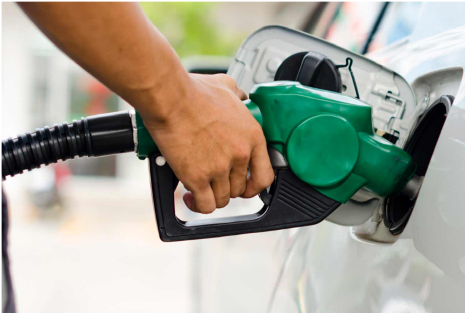
Será avaliado se os estabelecimentos possuem medidas adequadas de contenção de descargas elétricas e se possuem projetos de combate a incêndios aprovados pela corporação

A promotora também requisiu à Secretaria de Estado de Meio Ambiente e Desenvolvimento Sustentável (SEMAD) que informe se as condições estabelecidas nas licenças ambientais dos empreendimentos estão em conformidade e se fo-