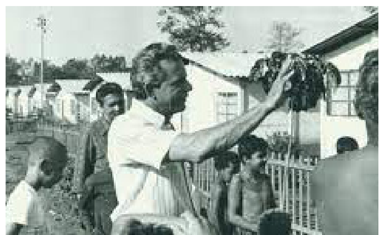
Iris Rezende, criador dos mutirões: estratégia quase o levou a disputar presidência da República

Tornou-se famoso por 'levantar' mil casas populares em um único dia - evento em 1983, fundado em pesado discurso de marketing, que alavancou seu nome, sendo cogitado para disputar a presidência da República. Mas inicialmente tratava-se de ideia de construção coletiva de moradia popular - e não serviços, como é hoje.