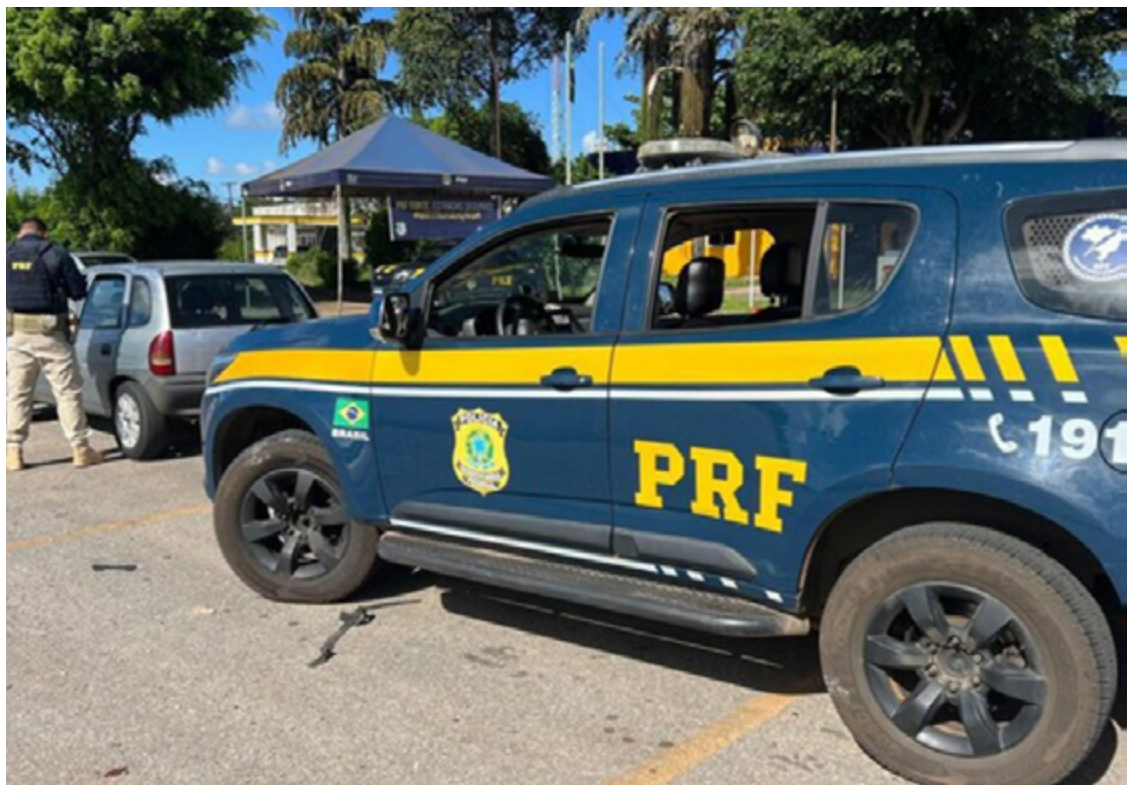
Os nomes dos suspeitos detidos não foram divulgados até o momento

Os nomes dos suspeitos detidos não foram divulgados até o momento. A PRF continua atuante na região, intensificando suas operações com o intuito de coibir crimes como furtos e roubos de veículos.