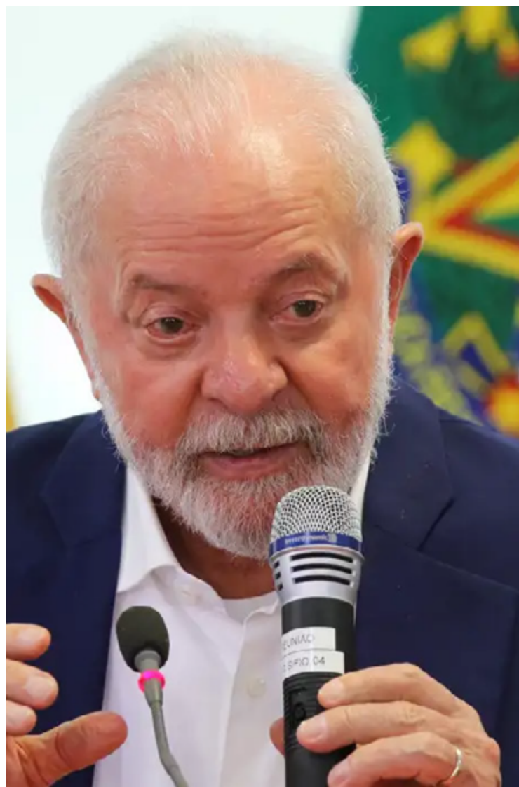
Lula da Silva: negociações para evitar derrotas no plenário do Congresso

O projeto seria votado quarta-feira na CCJ (Comissão de Constituição e Justiça) do Senado, mas saiu da pauta no início da sessão a pedido do relator e líder do governo na Casa, Jaques Wagner (PT-BA). Pelo acordo que vinha sendo costurado, parte do dinheiro extra seria usado pelo governo para recompor o valor das emendas parlamentares durante a sessão do Congresso desta quarta.