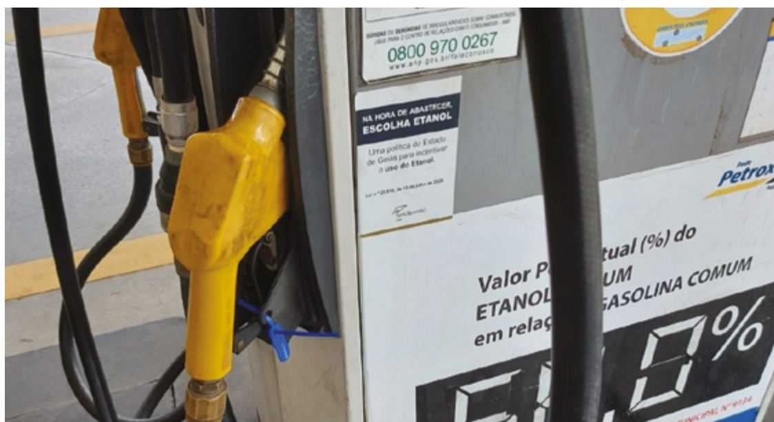
Com nova norma, carga tributária atual do etanol hidratado de cana-de-açúcar em Goiás, hoje de 5,2%, será reduzida para 3,2%

cam um impacto financeiro estimado em R$ 67,9 milhões até o final deste ano, com um custo previsto de R$ 107,6 milhões para 2025 e R$ 113,6 milhões no último ano do mandato. Estes investimentos visam fortalecer a indústria local de biocombustíveis e impulsionar o cresci-