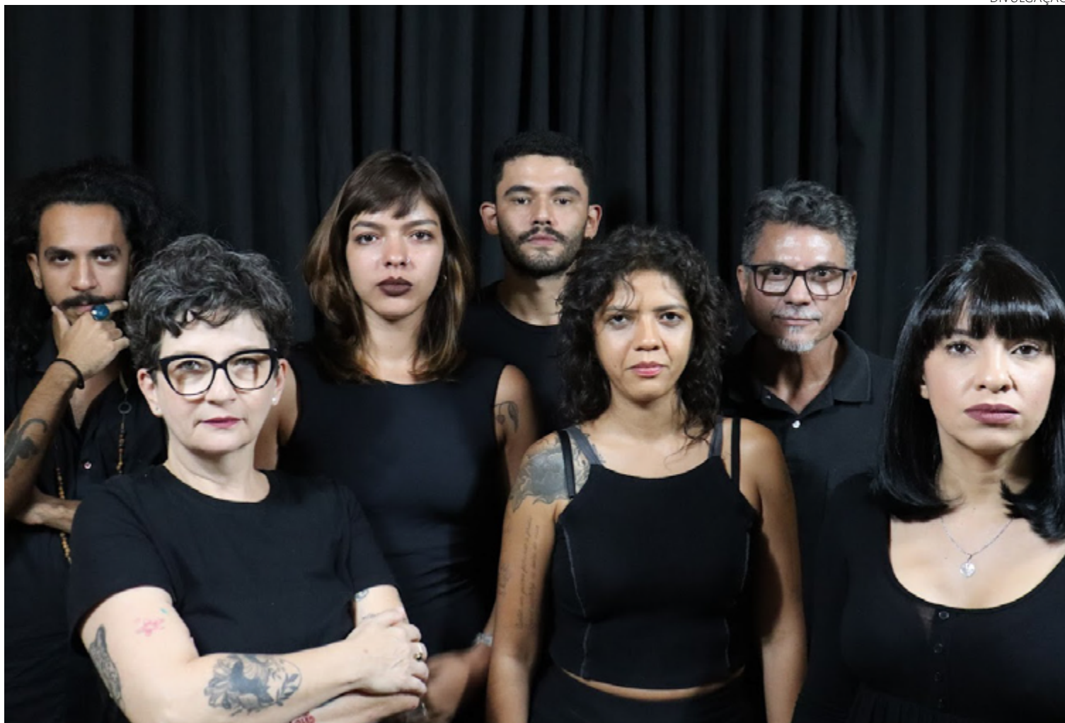
Grupo nasceu em 2009 como projeto de extensão na Faculdade de Letras da UFG