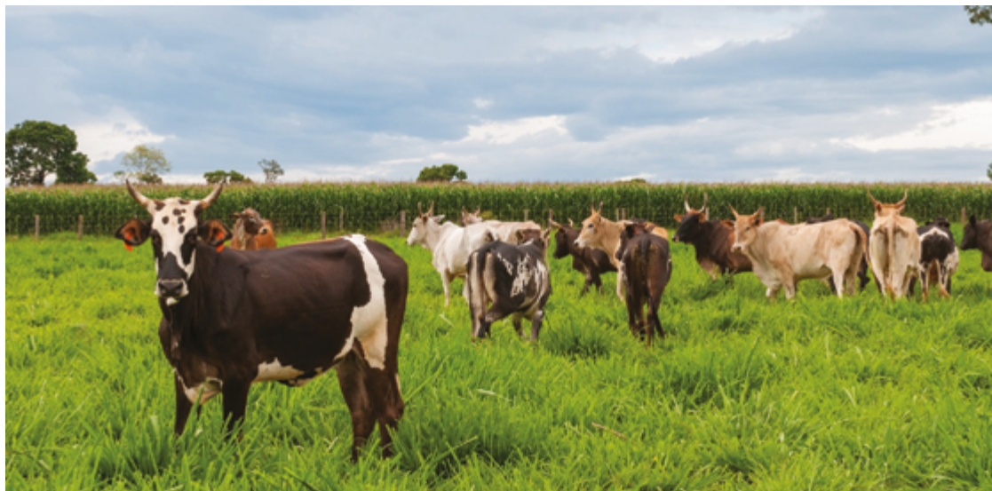
Prazo para vacinação obrigatória contra raiva de herbívoros nos municípios de alto risco para doença também começa em 1º de maio

A declaração deve ser realizada pelo Sistema de Defesa Agropecuária de Goiás (Sidago), por meio de login e senha exclusivos do titular da propriedade. A orientação da Agrodefesa é que os dados informados na declaração sejam compatíveis com a realidade da propriedade, desde cadas-