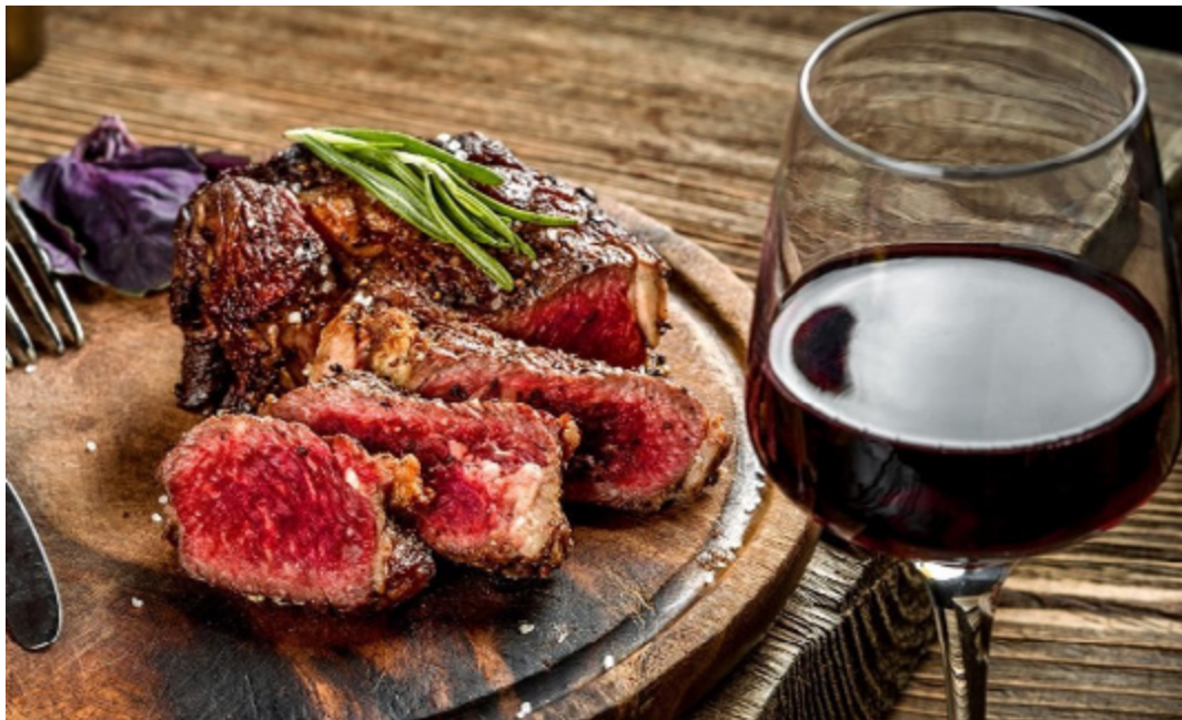
Um clássico: harmonização mais comum para carnes vermelhas é o vinho tinto

Sem dúvida, o churrasco é uma paixão nacional. Cada detalhe, desde o corte escolhido até a técnica de cozimento, influencia no resultado final. E quando se trata de aprimorar essa experiência, a harmonização entre carnes e vinhos. Ao selecionar vinhos para acompanhar cortes como picanha e costela, é fundamental considerar características como acidez e presença de taninos para equilibrar a gordura e textura das carnes, uma boa dica é considerar a experiência que se quer destacar. O tempero pode variar de acordo com o que se quer ressaltar na carne, se é o sabor mais puro do corte, ou uma diferenciação de sabores com o uso de temperos.