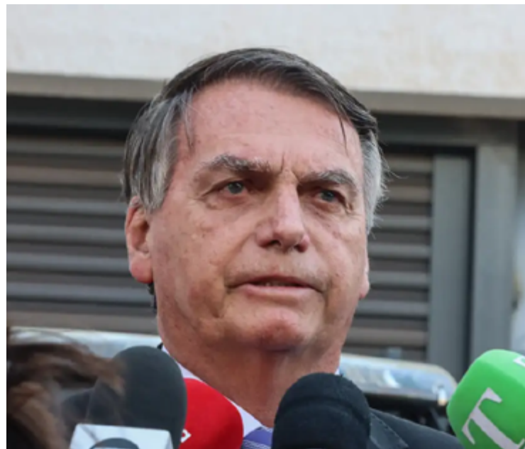
Jair Bolsonaro não pediu asilo político em embaixada

Moraes, então, pediu que a PGR emitisse opinião sobre as explicações. A PGR não viu necessidade de suspensão das cautelares. A decisão de Moraes segue o entendimento da PGR.