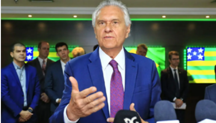
Governador Ronaldo Caiado lança Programa de Eficiência Energética do Governo de Goiás: meta é economizar 25 milhões por ano