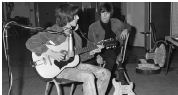
Instrumento estava perdido há 50 anos