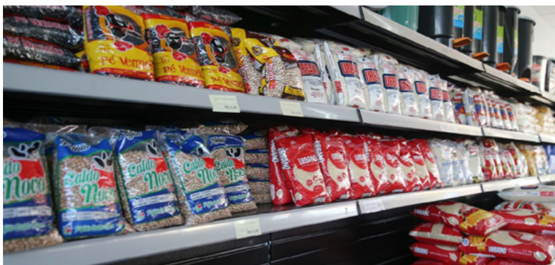
Governo propôs ainda uma lista estendida de alimentos com alíquotas zero

Outros 14 tipos de alimentos tiveram alíquota reduzida em 60% no projeto de lei: carnes bovina, suína, ovina, caprina e de aves e produtos de origem animal (exceto foie gras),