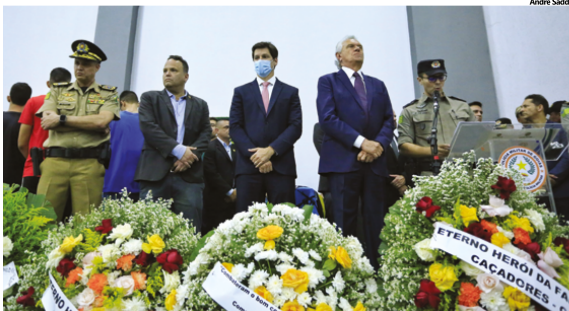
Ronaldo Caiado manifestou “profundo pesar” pelas mortes e destacou que Estado deve amparar familiares

O subtenente Gleidson chegou a ser resgatado com vida no local do acidente, mas não resistiu aos ferimentos e morreu. Era especializado em patrulhamento tático. Tinha formação em Rondas Ostensivas Táticas Metropolitanas e atuou em vários batalhões. “É um momento de comoção. Desde ontem (quarta-feira, 24) decretei luto oficial de três dias e estou aqui para dizer a todos os familiares o quanto o Estado é grato por homens tão deter-